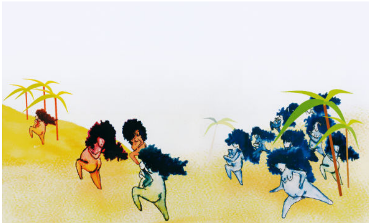
Agnės Kananaitienės iliustracija

Ši paroda – tai puiki galimybė supažindinti žiūrovus ir tarptautinę auditoriją su naujos kartos dailininkų kūryba. Parodoje eksponuojami Vilniaus dailės akademijoje bei Kauno dailės fakultete studijuojančių bei neseniai studijas baigusių dailininkų darbai.